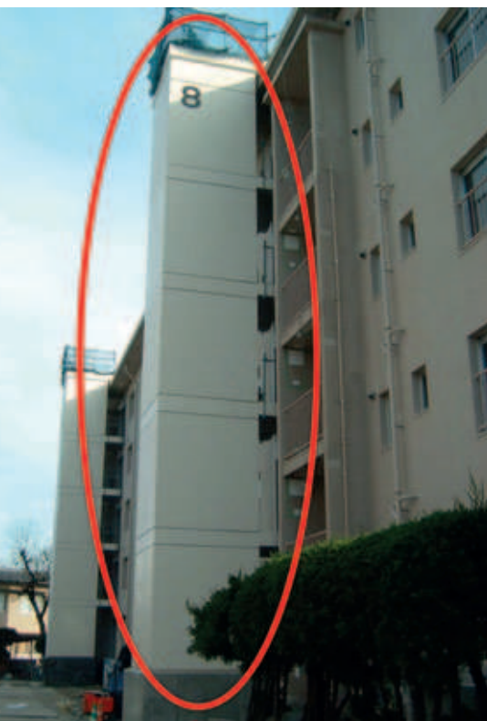
Les cages d'ascenseurs peuvent être montées à l'extérieur du bâtiment

La seconde requiert certes moins de temps, mais nécessite beaucoup d'espace pour les opérations de montage dans le bâtiment, qui sont de plus assez risquées pour les monteurs.