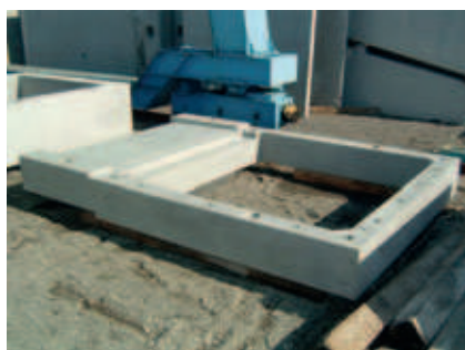
Transport vers le chantier en plusieurs étapes d'une cage d'escalier en éléments préfabriqués en béton